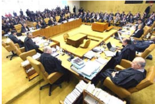
Julgamento do Mensalão no STF: disputa interburguesa, PT no banco dos réus

O Programa de Transição da IV Internacional não só mantém sua vigência, como se mostra indispensável para organizar as massas na situação de crise estrutural