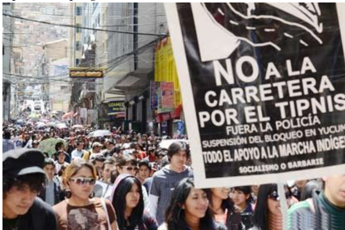
Na Bolívia, as massas se chocam com o governo impostor de Evo Morales

O Congresso assinalou com precisão a tarefa do partido expressar o programa de transição da revolução boliviana.