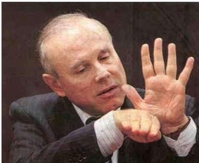
O ministro Mantega expressou a posição do governo Dilma, de defesa das multinacionais

a queda de 5,3% nos últimos doze meses obriga a uma reacomodação na capacidade produtiva.