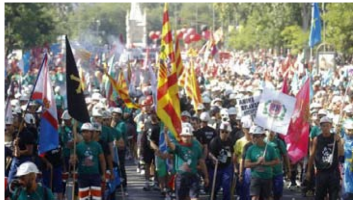
Crise capitalista: empregos ameaçados. Responder com as bandeiras e métodos de luta do Programa de Transição

As dificuldades de organização do Comitê de Enlace prejudicam o trabalho destinado a quebrar o isolamento do POR e, portanto, do proletariado diante do movimento revolucionário mundial.