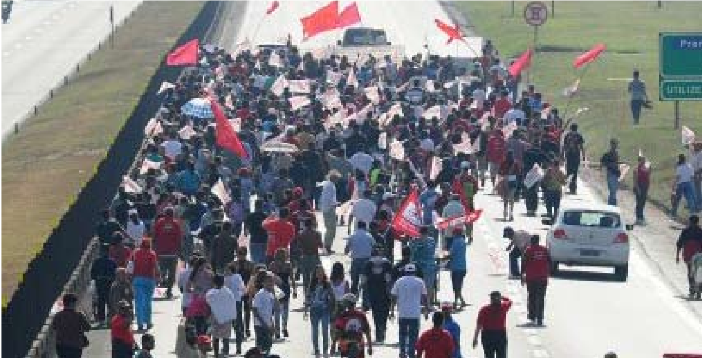
Operários da GM em manifestação na Rodovia Dutra em defesa dos empregos

O desenvolvimento da crise econômica comparece como o principal problema para a classe operária e demais explorados. O governo petista de Dilma Rousseff não pode ocultar que as tendências recessivas mundiais arrastam o Brasil para o precipício. A burguesia não tem outra solução senão sacrificar empregos e golpear as condições de existência da maioria oprimida. A burocracia sindical submeteu as organizações de massa ao governo e ao grande empresariado. As multinacionais que controlam os ramos fundamentais da economia vêm assinalando a inevitabilidade das demissões, caso a queda de crescimento continue a vigorar. Alguns setores já fecham postos de trabalho.