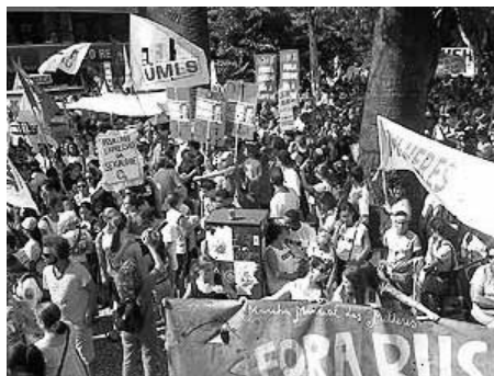
Manifestação no Brasil contra visita de Bush

O desenvolvimento capitalista, imposto de fora para dentro, não permitiu que ela superasse as heranças do colonialismo e não possibilitou a formação de um Estado burguês, que pudesse resolver as tarefas democráticas, entre elas a da soberania nacional, da questão da terra e da elevação cultural das massas.