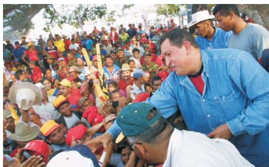
Chávez distribui títulos de terra

giu como franco atirador que chegou a ser cotado a ser presidente. Alcançou 47% contra 52% de Alan Garcia, no segundo turno. Esse processo indica que a instabilidade do regime político permaneceu.