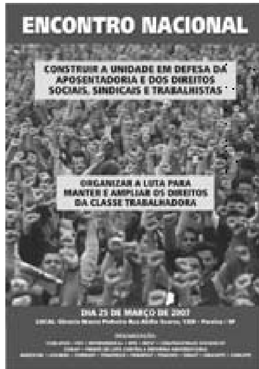
Um Encontro Nacional de cartas marcadas e sem a possibilidade real de discussão pela base da unidade

A iniciativa de organizar um movimento unitário contra as reformas anti-populares do governo é correta e necessária. Mas não deve ser limitada ao quadro institucional do Estado, do parlamento e do governo. Estamos diante de um brutal ataque contra a vida dos