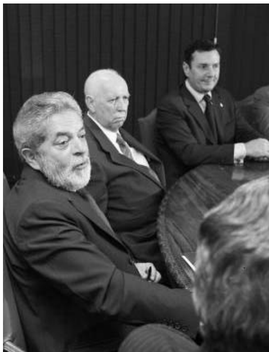
Lula recebe Collor “com muito carinho”. Collor é parte da base de apoio do governo de coalizão

O núcleo ministerial petista do fim do segundo mandato permaneceu, com algum remanejamento. Ficaram aqueles confiáveis a Lula. Não houve despetização tão radical, mas o suficiente para o PMDB se sentir honrado e seguro quanto a seus propósitos de influenciar nas decisões de Lula e manejar parte significativa do poder do Estado.